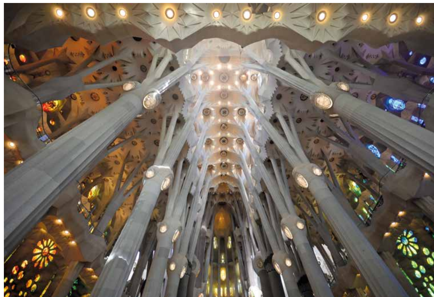
Sagrada Família ▲

Igen, de mindegyik külön alapítvány és külön egység, nem egy közös Gaudí-alapítványhoz tartozik. Ennélfogva a kínálat is egészen változatos. A Güell parkról például nem vásárolhatunk meg minden könyvet a Sagrada Família hatalmas könyvesboltjában. Az a cél, hogy aki igazán kíváncsi, személyesen keresse fel az adott helyet. Ha akarsz egy erkélykorlát-részletet venni a Casa Batlló-ról, akkor azért bizony ott helyben kell sorban állni.