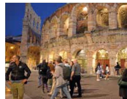
◀ Aréna, Verona