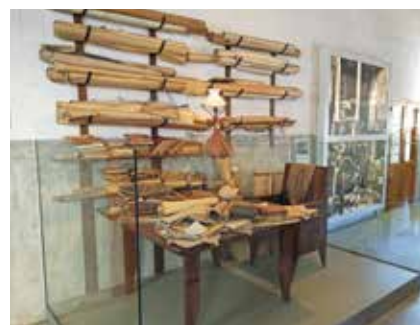
▼ Sagrada Família, Születés-kapu, részlet, Etsuro Sotoo