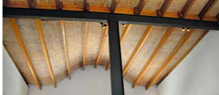
◀ Gaudí áthelyezett és felújított dolgozószobája, téglafödém részlet

lunk. A nagy középső torony csak félig áll, még közel száz szobor, és ugyanennyi harang hiányzik. Gaudí csóharangokat tervezett, amelyek orgonasípszerűen lesznek elhelyezve. Mindez kézi munkát igényel, amit nem lehet gyorsítani, hiába lenne rá pénz.