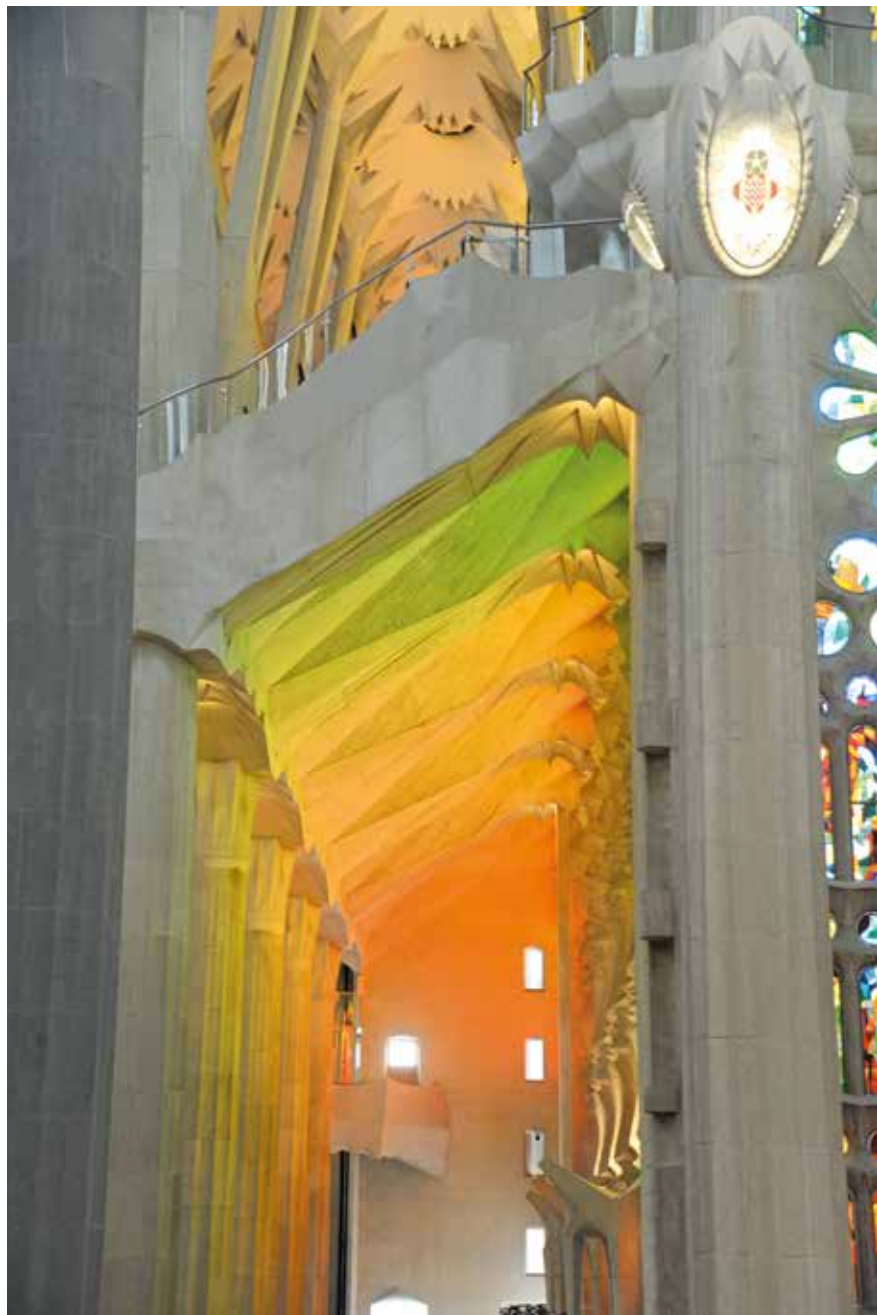
Sagrada Família ▲

Nagyon sziszifuszi munka ez. 2026-ban lesz száz éve, hogy meghalt Gaudí, nagy a nyomás. Ugyanakkor rengeteg a feladat: ami nem pontosan olyan, ahogyan azt a mester elképzelte, lebontják. Tervbe vettek közterület-rendezéseket, ehhez pedig módosítani kell a rendezési tervet, ami ott sem egyszerűbb, mint ná-