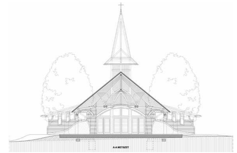
▲ A-A metszet

Az épület hagyományos szerkezettel épült. A sárgás színű téglafalak fehér vakolt felületekkel egészülnek ki, a faszerkezetek natúr, a cserepek piros színűek. A ravatalozó tengelyesen szimmetrikus, a középső szertartástér köré vannak felfűzve a kiszolgálóhelyiségek. Az épület keleti oldalán egy várakozószoba és a közösségi vizesblokk, a nyugati oldalán egy tárolóhelyiség és a