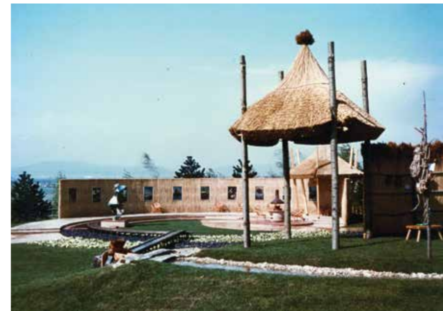
Magyar kert, Nemzetek kertje, Kertészeti Szakkiállítás, Bécs, 1974 ▶

Szakterületünknek van egy kivételes ága, ahol bírálatok alapján minősítik a létesítményeket. A nemzetközi kiállítások állandó témája a nemzetek kertje vetélkedő. Erre a kiállítások rendezői meghívják azokat az országokat, amelyeknek kertkultúrája ismert. A kertnek olyannak kell lennie, amelynek nemzeti jellege van, és amelynek főbb elemeit a kiállító ország szakemberei építik meg. 1973-ban Hamburgban bronzéremmel a harmadik helyre kerültünk, Bécsben a 74-es kiállításon a magyar kert volt az első helyezett. 1983-ban Münchenben két aranyérmét is kapott. Stuttgartban 1993-ban ezüstéremmel díjaztak. Mindegyik kert tervezője, kivitelezés-irányítója személyem volt.