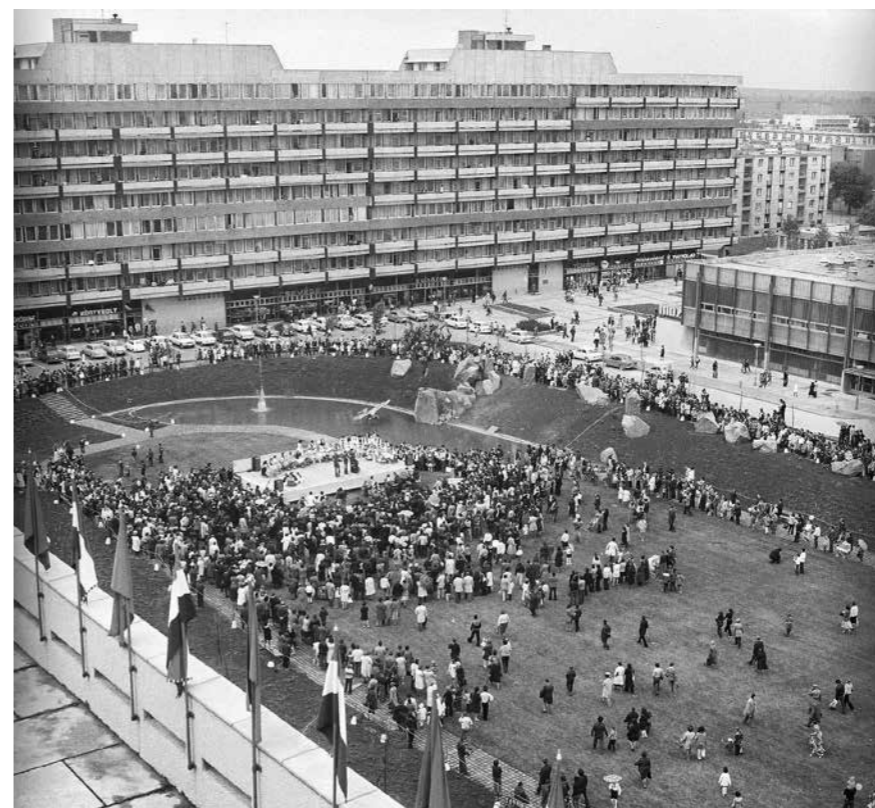
◀ Átadás, Prométheusz park, Szekszárd