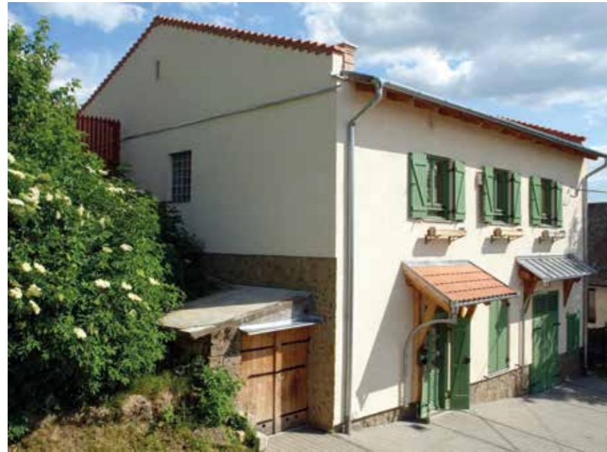
▼ Termelőszövetkezeti préház átalakítása lakóházzá, Budajenő, 2014