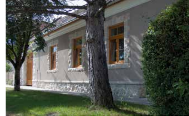
◀ Községi ház, felújítás és bővítés, Budajenő, 2015

téseket is, amelyek távol esnek ugyan a szakmájától, de a közösség bízunk