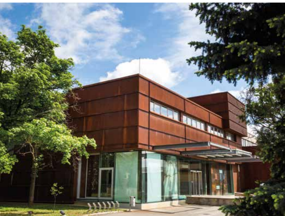
▲ Az egykori konzervgyár átalakításából született meg a Paksi Képtár új épülete. Építész: Kiss Gyula, Járomi Irén, 2007

Ha egy ötlet mögött olyan erős megfontolások és koncepció van, hogy összeáll egy izmos egésszé, akkor egy bírálóbizottság örömmel ad első díjat. Amennyiben minden pályázatnál maradnak nyitott kérdések, akkor, bár első díjat nem adunk ki, ez az eredmény is elfogadható, hiszen ennek a pályázattípusnak nem folytatása a tervezési munka vállalásba adása. Az alapvető cél az, hogy a város a konkrét tervezési programhoz kapjon municíót. Való igaz, hogy az értékelt megoldások egyike sem ad teljes egészé-