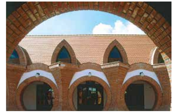
A piacnál a tervtől eltérően a fedett elárusítóhelyeket kis üzletekre osztották. Építész: Makovecz Imre, 1989.

Először is nagyon pontosan fel kell mérnünk a város potenciálját, hogy ne befejezetlen, élet nélküli terek jöjjenek létre. Paks már megélt egyszer ezt a folyamatot, amikor a kis mezővárosban egyszer csak megjelent az atomerőmű, és megépült a lakótelep. A lakótelep és a régi történeti belváros között félúton kialakítottak egy új, az akkori politikai berendezkedésnek megfelelő városközpontot tanáccsal, pártházzal és szállóval. Ez a maga módján mostanáig jól is szolgált, de az új elképzelés szerint a kormányhivatalok és az ahhoz kapcsolódó szolgáltatások helyét jelöltük itt ki. Ma Paksnak van egy főutcája, de nincs olyan közösségi tere, amelyet egy európai kisvárostól elvárnánk. Éppen ezért merült föl az az elképzelés, hogy a városháza, az oktatási és a kulturális intézmények súlypontjában létrehozunk egy olyan közösségter-rendszert, amely méltó keretet ad a különböző városi eseményeknek, rendezvényeknek. Ez részben egy közterületi megújítás,