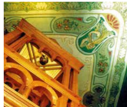
▲ Fotó: Panyik István