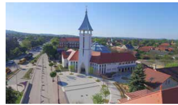
◀ Fotó: Szabó László