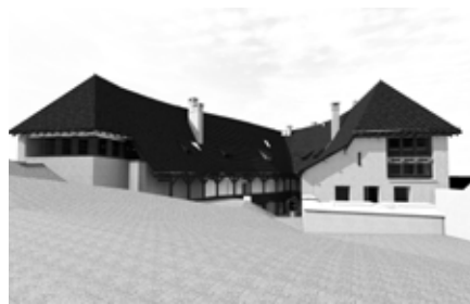
▲ Rekonstrukció II. ütem, látványterv. Építész: Rudolf Mihály