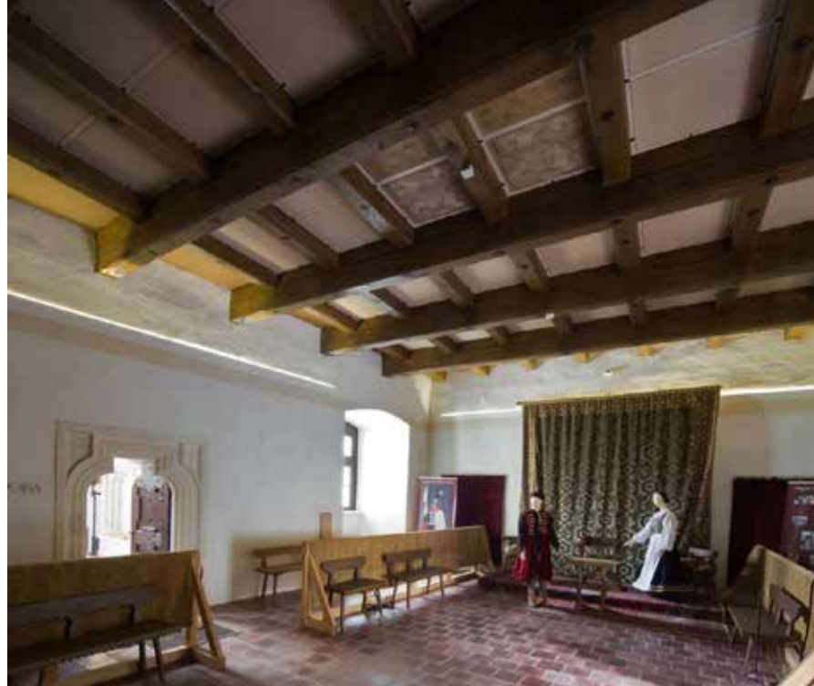
▲ Kazettás famennyezet az öreg palotában.