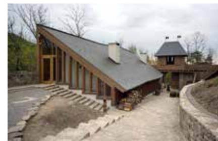
▲ Alsó vár. Építész: Skardelli György, Kelemen Bálint 2013