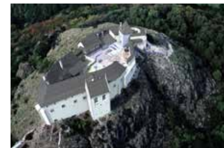
▼ Kápolna, Füzér.

Sárkányfejes vízköpő. ▶