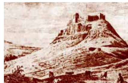
◀ Greguss János metszete, 1868

és tájképi jelentőségén túl növényzeti szempontból is kiemelkedő értékeket hordoz. 3 A vár szinte megközelíthetetlen, oda nem vezet kocsiút. Az alsó várhoz a „nyeregből” induló szerpentin lehet feljutni. Onnan egy sziklába vágott lépcsőn át érünk a felső vár kapujáig. A sziklalépcső mellett valaha egy sziklába vájt felvonó szolgált, aminek csúszdáján a málna a várba érkezett. A hegytető egy 40 x 70 méteres amorf formájú terület, melynek nyugati része négy méterrel mélyebben helyezkedik el a keletinél. Az udvart egy másfél méter vastag, bentről 6 méter magas kőfallal övezték. Ez a fal kintől tekintélyesebb, hisz padkája a mélyebben fekvő sziklaszintet folytatja. A várfal építéséhez a helyszínen kitermelt kőanyagot (andezit) és füzérkomlósi riolittufát használtak. Az északkeleten megmaradt eredeti várfalszakasz lenyomatai és az inventáriumok tanúsága szerint a várfalakon gyilokjáró futott körbe, melyről meg lehetett közelíteni az egykori nyilazóhelyeket, fokokat, védőpártásokat. Az erőd északkeleti részén nyílt a várkapu. Délnyugati sarkában emelke-