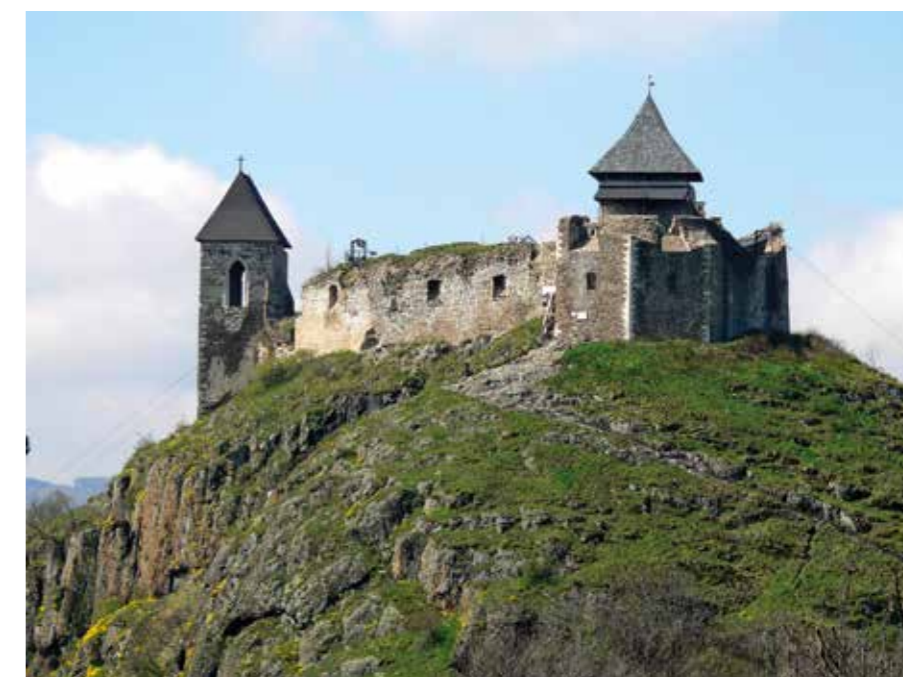
Rekonstrukció előtti állapot, 2008. Fotó: Vida Márta ▲

A füzéri várral kapcsolatos történeti kutatások forrásbázisa megközelítőleg azonos a magyar történelem általános forrásadottságaival. Az Árpád-kor utolsó évszázadában, a 13. században bukkan fel első ismert említése. Királyi donációk, adománylevelek, birtokmegosztó oklevelek dokumentálják a vár, illetve a hozzá tartozó várbirtok történetét a 14. és a 15. században. A vár kisebb megszakításokkal a Perényiek tulajdonában volt. (A vár részletes történetét Rudolf Mihály írása taglalja. – A szerk.) A vár történetében Nádasdy Ferenc országbíró elfogása és elítélése jelentette a tragikus véget. Nádasdyt a Wesselényi-szervezkedés tagjaként, felségárulás vádjával ítélték el és végezték ki Bécsben 1671-ben. A szervezkedő politikusok az 1664-es vassvári béke újratárgyalását, az ország érdekeinek megfelelő új megállapodást akartak elérni, ám ez ellentétes volt az abszolutista elveknek megfelelő kormányzati átalakítást végrehajtó Habsburg dinasztikus törekvésekkel. Az uralkodó akaratával való szembefordulás pedig elégséges indok volt a felségárulás vádjához, egyben ürügyet is szolgáltatott a magyar politikai rendszer felszámolásához. Nádasdy kivégzése után Füzért a magyar kamara igazga-