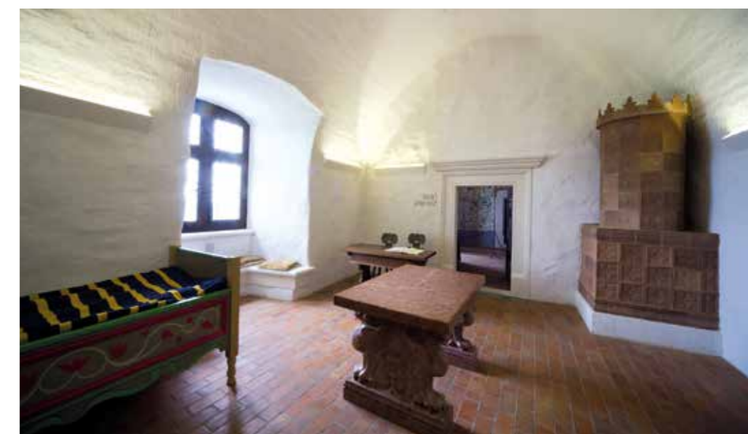
▼ Fotó: Zsitva Tibor

Mindennek ellenére nem a 17. századi vár épült vissza. Minden rekonstrukció nagyszerűsége, egyben veszélye is abban rejlik, hogy az éppen aktuális jelen hogyan viszonyul a múlthoz. A füzéri vár ízig-vérig kortárs épület. Nemcsak azért, mert a jelen építészeti szabványainak kellett megfelelnie, hanem leginkább azért, mert napjaink történelmi szemléletét tükrözi. Érvényes ez az építészeti megvalósításra és az enteriőrök kialakítására, vagy éppen a történelmi ismeretek átadásának különböző eszközeire. A füzéri vár egyszerre szól a múlttól és az aktuális jelenről. Mint rekonstrukció tökéletesen visszaadja a történelem legmélyebb értelmét: a folyamatosságot. A történelem sohasem lezárt.