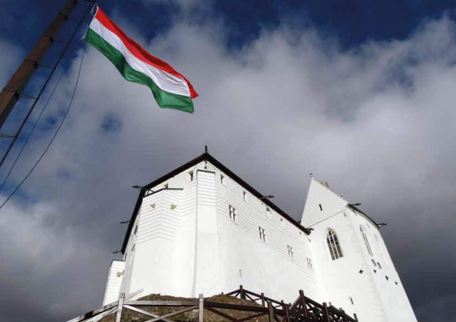
Fellelégvár, Füzér. ▲