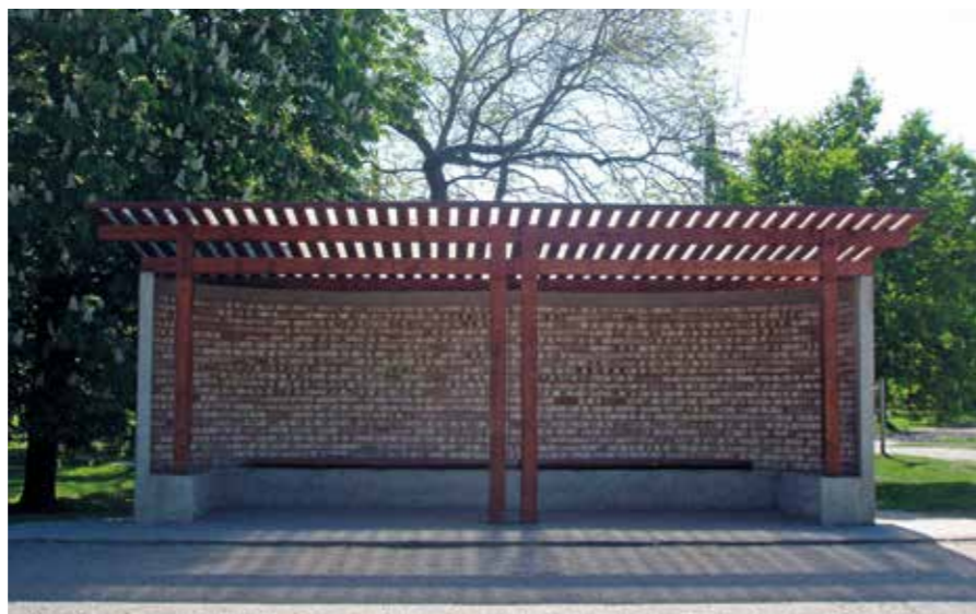
▲ Buszváró pavilon, Tiszaszentimre, 2004

Á. Á.: Makovecz Imre azt mondta, hogy nem a mester választja a tanítványt, hanem a tanítványok gyűlnek a mester köré. Jelenleg nem tülekednek nálunk a tanítványok, és nem is látok olyan csillagállást, ami ennek kedvezne. Néhány évig volt szerencsém a Műegyetem Urbanisztika Tanszékén tanítani külsős konzulensként. Azt reméltem, a személyes kapcsolat révén sikerül néhány fiatalt megmozdítani. Ezt a folyamatot azonban a válság lenullázta, hiszen ahhoz, hogy hosszú távon két-három fiatalt el tudjunk tartani, folyamatos, fizető munkák kelljenek.