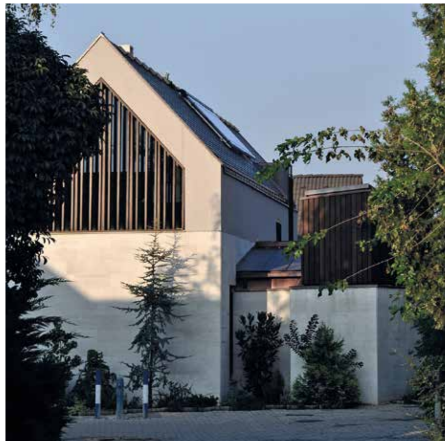
▲ Családi ház bővítése, Tabán, Szolnok, 2012

► Hazajöttek Szolnokra, majd hamarosan egy irányítás és kapaszkodó nélküli helyzetbe kerültek. Hogyan találták meg ezt követően a saját útjukat, a helyiekkel való kapcsolatot?