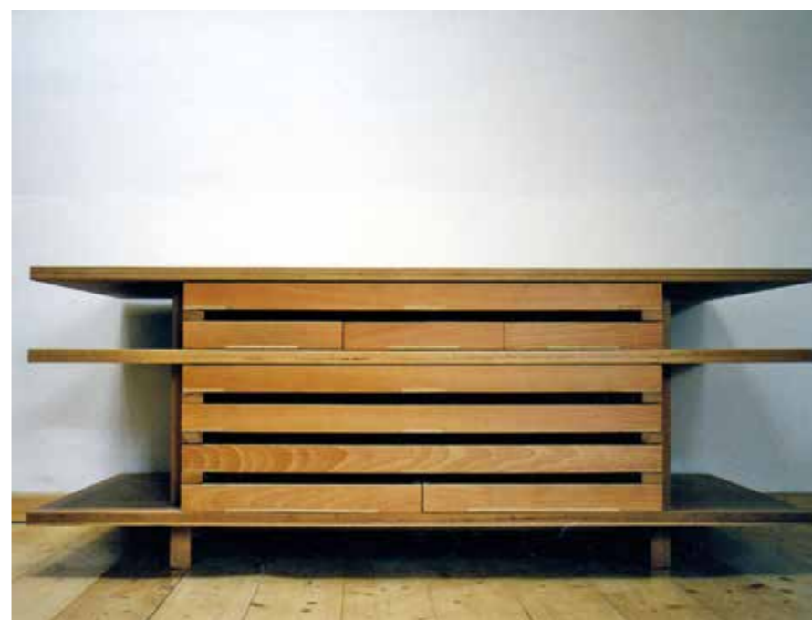
▲ Rajztartó, 2000

Cs. M.: A vándoriskolás éveink óta sok szempontból korszakváltás történt akár az építészetben, akár a társadalomban. Ez megnehezíti, hogy amit én tanultam lassan harminc éve, azt tovább tudjam adni. Igaz, hogy hat-hét fiatal dolgozott nálunk az utóbbi pár évben, és a velük való közös munka megmutatta, hogy ez oda-vissza működik: rengeteget tanultunk egymástól.