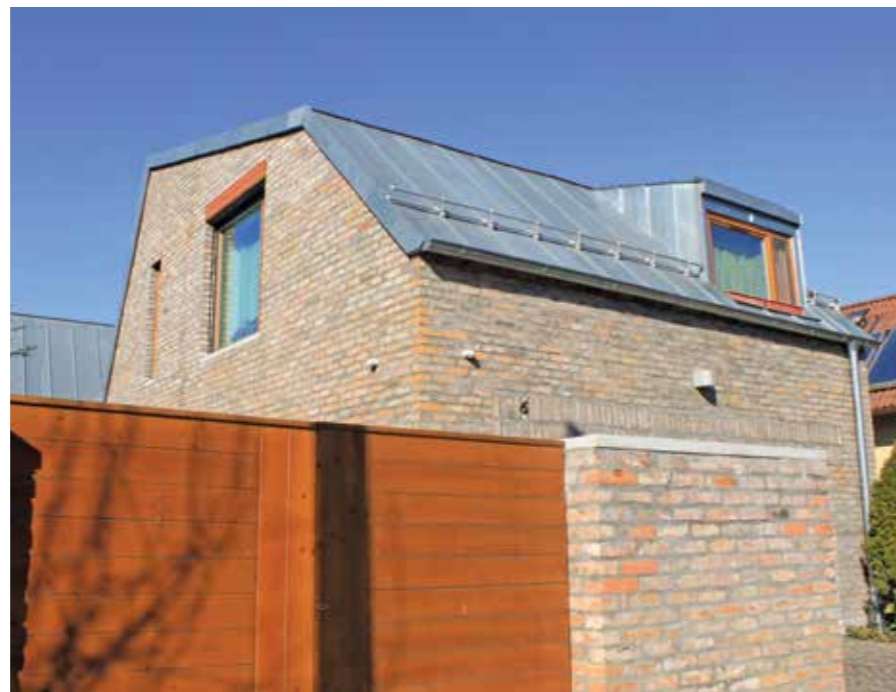
▲ Családi ház, Csillag utca, Szolnok, 2009