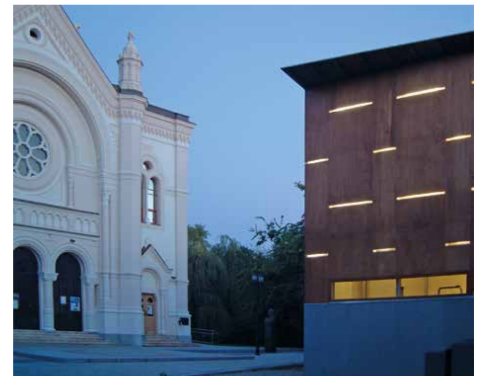
▲ Tisza(p)Art mozi, felújítás, Szolnok, 2005

Á. Á.: Nincs iroda, mert nincs annyi munka – mindeközben azonban azt látjuk, hogy a térségbeli fontosabb megbízásokat rendre fővárosi építészirodák tervezik. Nem tartunk össze itt vidéken, egymást erősítő rossz folyamatok tömkelegével találkozom.