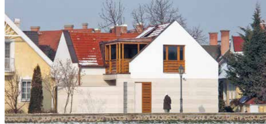
◀ Családi ház, Tabán, Szolnok, 2007