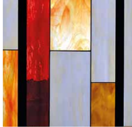
Lakóház felülvilágítója ▶