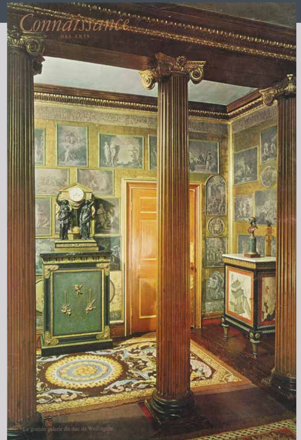
La grande galerie du duc de Wellington

Sétáltunk a Szajna-parton. Régi folyóirathalmokat forgattam át. Egy palotabelső tépetten is megragadó képével tértem haza. Egy belső, ahol a sötétbe beférkőzött