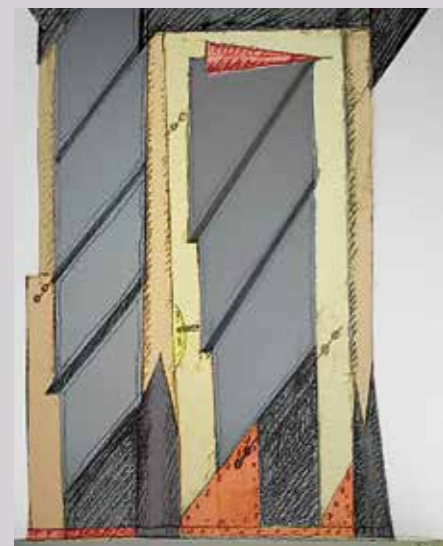
▲ Épületrészlet, 1995

Egykor a milleniumi Vajdahunyad vára eklektika-attrakciójának alkotója fogta egybe elképesztő profizmussal a már lefutó sablonos historizáló formaköszegyet. Ma a tetőt, falat egy anyaggal leöntés központos építészeti egységesség látványába vihetők bele tagoláspótlók, részletgazdagságot imitáló felszíni álnomensek. A nagyvonalúságra utaló, profi gesztusok nem jellemzők a kicsit másképp utakon járókra. Szurcsik János festő vagy Kis Péter építész nem kísérletezik új megoldásokkal, bátorságnak álcázza a máshol már lefutó technikai megoldások kíméletlenül következetes előadását – szerintem. Ha egy vizuális kultúrától megfosztott országban van valami normális-átlagos, annak tagadása természetes. A globalizált építészeti sablonok hazai városzövetbe