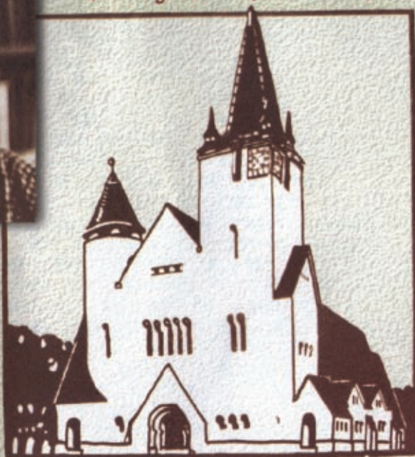
Biserica Reformată cu Cloca din Cluj

Personalitate a culturii și politicii maghiare din România, renumit arhitect cu o viziune proprie și originală pentru promovarea tradițiilor din Transilvania.