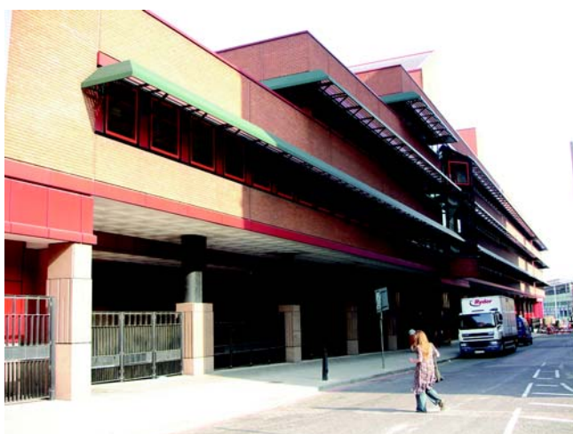
A londoni British Library (nemzeti könyvtár) új épülete Sir Colin St John Wilson 1977-es tervei szerint épült fel, de csak 1998-ban nyitották meg a közönség előtt. Az épület alaprajza A betűt formázza, előtte a könyvtárhoz tartozó köztéren áll a négy méter magas, Sir Isaac Newtonot ábrázoló szobor, Sir Eduardo Paolozzi skót szobrász műve, amelyet William Blake jól ismert grafikája ihletett. A lépcsőn álló piramis alakú faszervezetet építészhallgatók építették az évente megrendezésre kerülő londoni építészeti nap keretében.