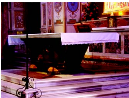
A San Bartholomeo templom oltára – San Nicolaos in Carcere templom oltára – a Santa Croce in Gerusalemme templom oltára

Hogy mi köze van a kádaknak a barokk retabulum oltárokhoz? Sokkal több, mint hinnénk. Elsőre talán nem túl feltűnő a közvet-