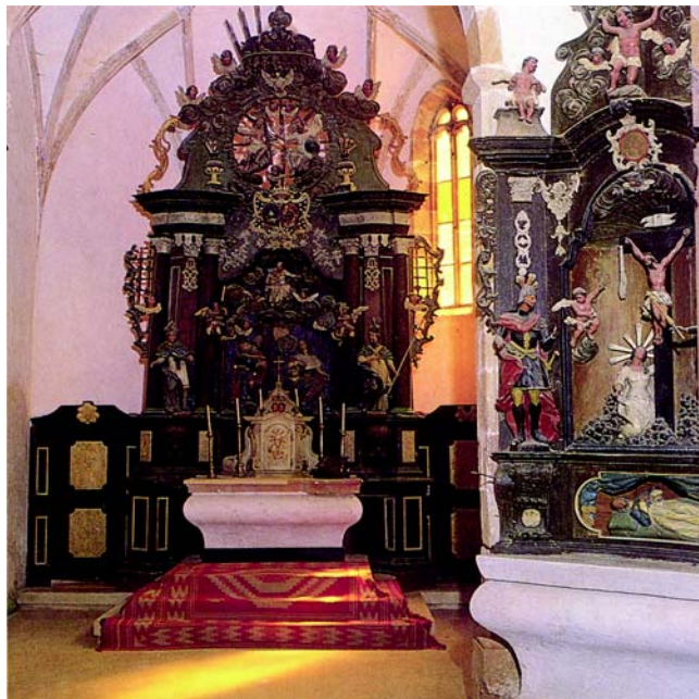
Koporsó formájú oltár, Sopron, Szentlélek plébániatemplom, 1750 – Koporsó formájú oltár, Nagyvázsony, Szent István király templom, 1740

len rokonság a kádak és a szarkofágok között. Mint már említettük, a szarkofágokon gyakran tűnnek fel a tisztulásra közvetlenül utaló részletek, de merőben praktikusak is, mint a leeresztő nyílás. Nyilvánvaló, hogy a leeresztő nyílásra nem a temetés miatt volt szükség. Érdekeselek a sarkokon kifaragott emelőgyűrűk, amelyek a kádak és szarkofágok közös szimbolikus elemei, egyikben sem szolgál (hiszen kőből van) praktikus célokat.