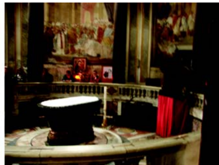
Római fürdőkád mint szökőkút, Farnese tér, Róma – Keresztelőkút a San Giovanni in Laterano baptisztériumban

és a közösség tagjai sátrakban laktak a központ körül. Nem a kellemes élet, nem a jólét kelléke volt tehát a fürdőzés, hanem – ahogy a zsidóság életének annyi más apró motívuma – a liturgiába épült bele, vagyis rítus.