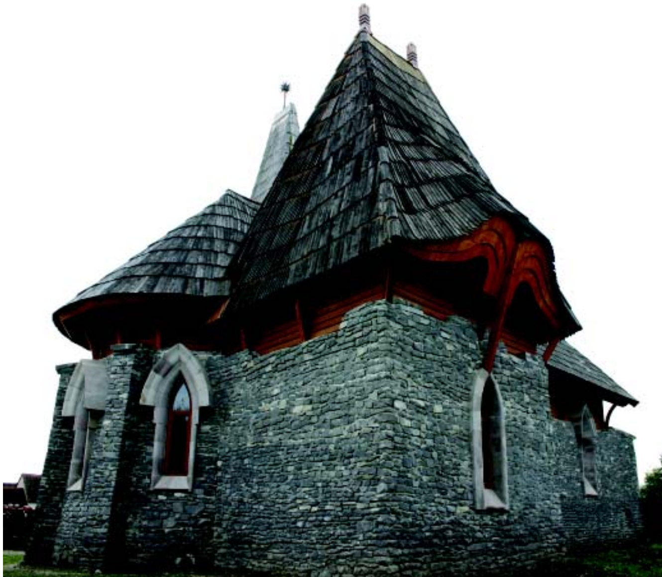
Makovecz Imre: a vargyasi református templom