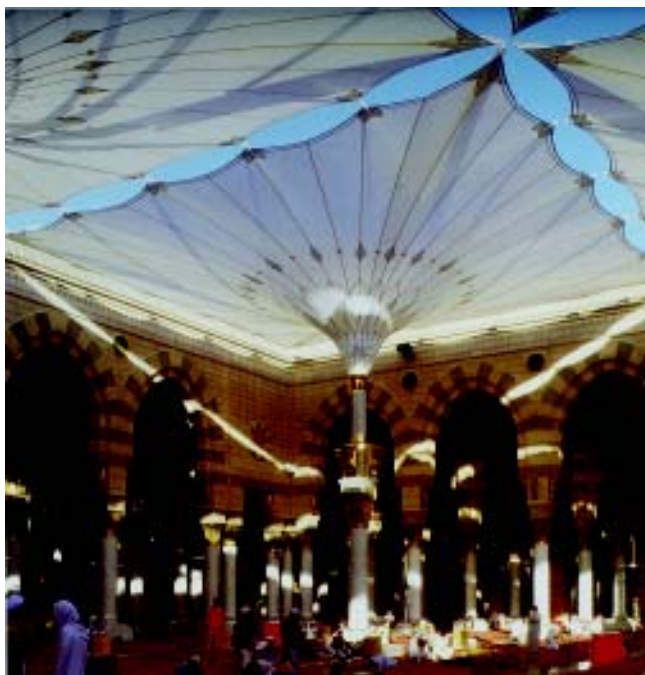
Medina, a mecset udvarát lefedő mobil árnyékvető emyők

Idén töltötte be nyolcvanadik évét FREI OTTO , a huszadi századi épületszerkezeti gondolkodás megújítója, a természetben található konstruktív erők mérnöki alkalmazásának mestere. Alkotó tevékenységének fő területei a sátor-, háló-, pneumatikus, függesztett, mozgatható és héjszerkezetek, az energiatakarékos és környezettudatos építkezés.