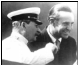
Sztálin és W. A. Harriman, moszkvai USA-nagykövet, 1941