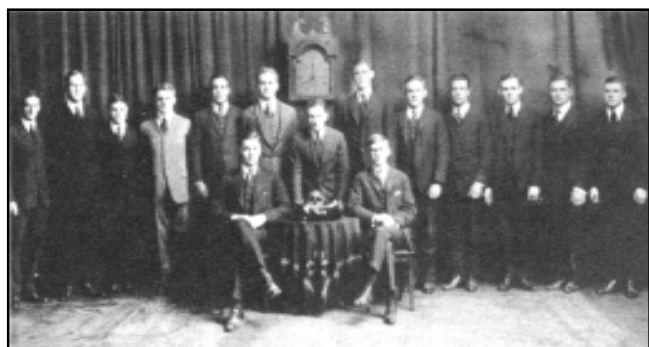
Az 1918-as „Csontok”, köztük a Union Banking Corp. későbbi társtulajdonosa, Robert A. Lovett (balról a negyedik)

Előfordul ugyan a politikai életben, hogy kormányzati tisztviselők, miniszterek, elnökök nem tagjai a Rendnek, de fiaik, unokáik igen, illetve szoros kapcsolatban állnak rendtagokkal, ilyenekkel veszik körül magukat a fontosabb posztokon, s a rendtagok cégei előnyöket élvezhetnek a gazdasági életben. Theodore Roosevelt sem volt tag (ő a Harvardon működő hasonló „kvázi-kékvérű” Porcelian, vagy Pig Club-nak, majd egy