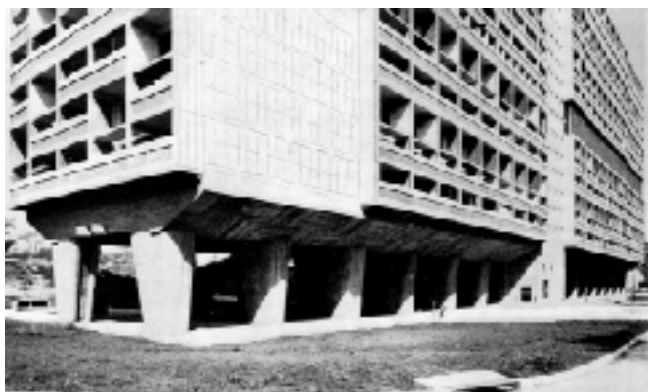
Marseille, a lakóház külső részlete és egy nappali szobája konyhával