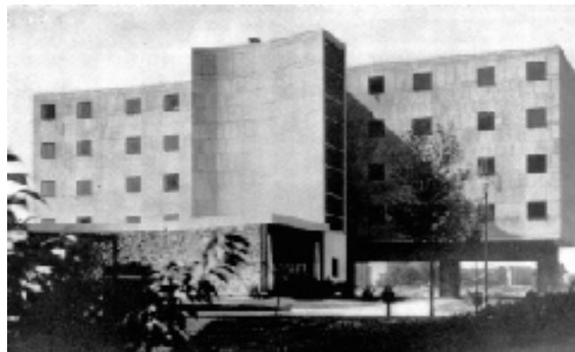
Párizs, a svájci pavilon az Egyetemvárosban; elülső és hátsó homlokzat

Nem volt adakozó, sem anyagi, sem érzelmi értelemben. Gyakran panaszkodott pénzügyi nehézségei miatt, s elszántan és hatékonyan védte az érdekeit. André Bloc több művét is kiadta abban az időszakban, amikor a sajtó még nem őt tekintette a világ legnagyobb