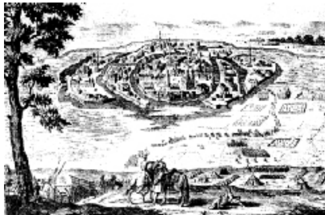
1601-es német metszet, amelynek földrajzi elhelyezése még sok vitára adhat okot (Székesfehérvár – Ósbuda)

A már említett 1601-es évben készült metszetek közül a francia – mert itt egy „KFOR-SFOR kereszties” nemzetközi hadtest harcolt – is csak ide azonosítható! A metszet, a 2000. május 7.-én készült légi felvétel és a Kartográfia 1:10 000-es térképének adatai pontosan