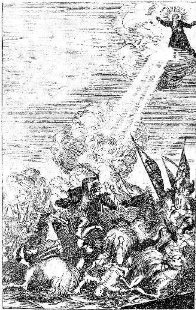
Mátyás király Remete Szent Pál segítségével győzelmet arat a török felett (német rézmetszet, Magyar Nemzeti Múzeum)

szakállá van, és itt jön a meglepő fordulat: a nép arra vár, hogy szakállá háromszor (egyes verziók szerint kilencszer) körbeérje a kőasztalt, és akkor támad fel Mátyás, akkor jön el az aranykor. Már mint annak a népnek, amelyik az ilyen legendát emlékeztében tartja. Jó, ha megismerjük egy nép emlékezte és népszelleme közötti kölcsönhatásokat.