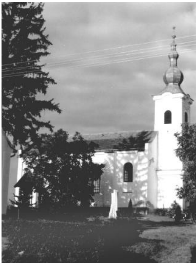
Sámód és (szemben) Dravapiski temploma (mai felvételek)

A lakosság összetételének változása a XIX. század második felében kezdődött. A jobbágyfelszabadítás után az uradalmi birtokokon nem volt munkáskéz. Az ekkortájt induló majorsági gazdálkodásban korszerűbb termelés kezdődött, gépesítéssel, új technológiákkal és új munkavállaló réteggel. Tanult, szakképzett mezőgazdászok, és olcsó munkaerőként cselédek települtek a nagybirtokokra. Szinte teljes egészében az engedelmesebb római katolikus vallásúak, köztük sok horvát nemzetiségű.