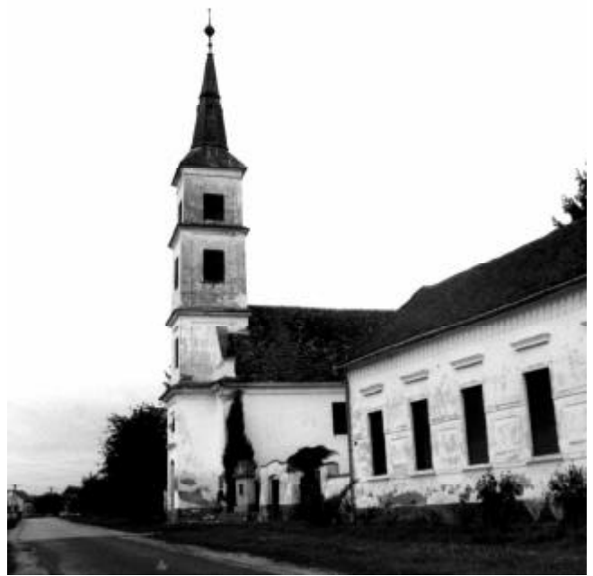
Fent: Kovácshida, lent balra: Kórós, jobbra Lúzsok település temploma

Böszörményi Krisztina: Cún, Drávacsehi. Drávapiski, Hirics, Ipacsfa, Kísszentmárton, Kórós, Kovácshida, Lúzsok, Sámod tájrendezési vizsgálata , 2001