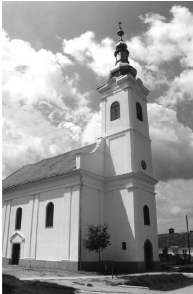
Ormánsági falvak templomai: a szemközti oldalon: fent Cún, lent Hirics; ezen az oldalon fent: Kísszentmárton, lent Kovácsbida (mai felvételek)

A színmagyar református tömbben a – betelepítésnél egyébként hihetetlen kedvezményeket élvező – németesség csak elenyésző mértékben tudott helyet szerezni, bár ennek a kevés, és nem jó minőségű szántóföld is oka volt.