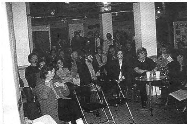
Faületés Orfűn és Magyarlútkafán; megemlékezés a Tölgyfa Galériában