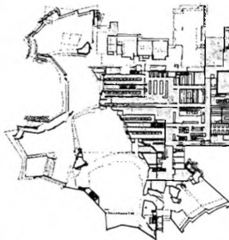
Otaniemi, Dipoli diákcentrum terve és fényképe