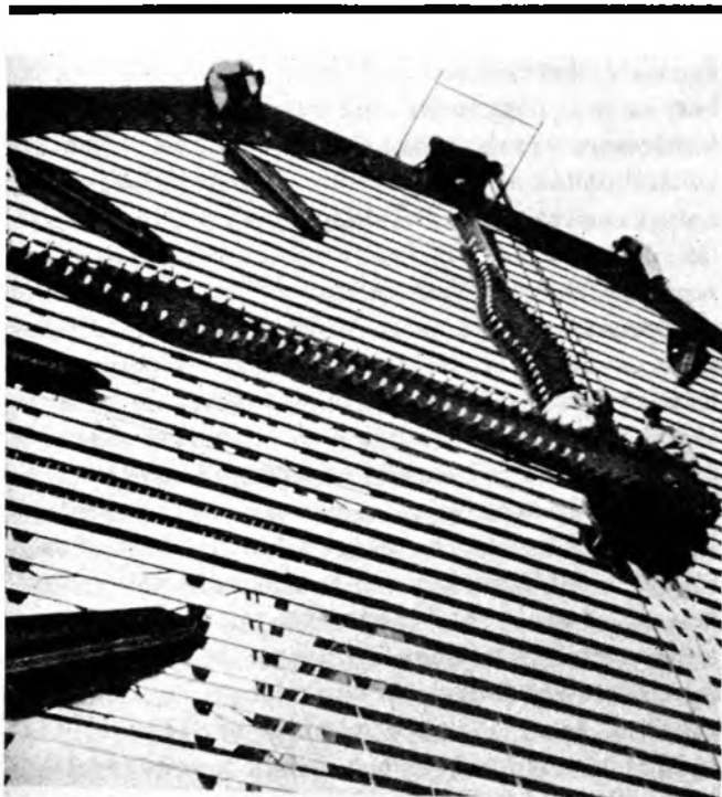
Javítják a világ legnagyobb óráját - Jersey City

A szecesszió az elszakadás előtti utolsó pillanat volt. Egy szempillantással később a repülőgép kerekei elemelkedtek a földtől, és a gép egy új közegbe került. A felszállás pillanata 1917 volt, amikor az emberiség a hagyományos térbeli világból kollektív értelemben átlépett az Időbe, és ezzel nagykorúvá vált. Azok a szellemi hierarchiák, amik a hagyományos világ képében útján ezidáig kísérték és védtek, ettől kezdve saját kezébe adták a sorsát. 1917-ben új nagyhatalmak váltak meghatározóvá a világfejlődésben, és velük a városfejlődésnek is egy új korszaka kezdődött.