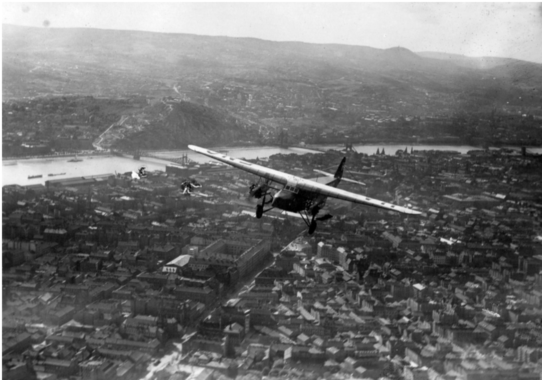
Magyarország, Budapest légifotó, előtérben az Üllői út. Magyar gyártású Fokker F-VIIIB típusú utasszállító repülőgép.