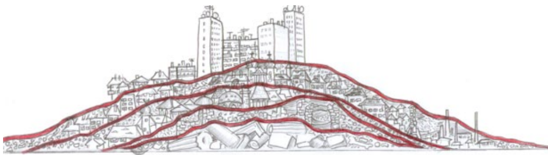
1. ábra Korok, értékek, rétegek