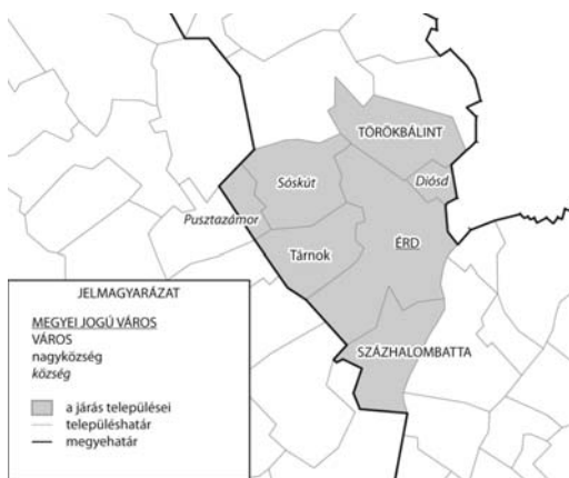
1. ábra Az Érdi kistérség

A térképet készítette: Czirfusz Márton (2013)