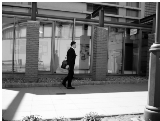
4. és 5. ábra: A közgazdasági és jogi karra járó hallgatók öltözködésének illusztrációja

Összegzésként szeretném felvázolni a legfőbb eltéréseket a bölcsészhallgatók és a jogi vagy köz-