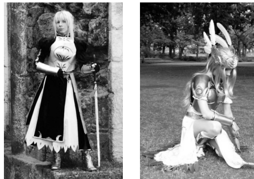
10. és 11. ábra: Anime-jelmezek

Vizsgálati módszerem a résztvevő megfigyelés volt. Két alkalommal figyeltem meg a csoportot. Úgy döntöttem, a megfigyelések alkalmával nem árulom el kilétemet és szándékomat, mivel az valószínűleg befolyásolta volna alanyaim viselkedését.