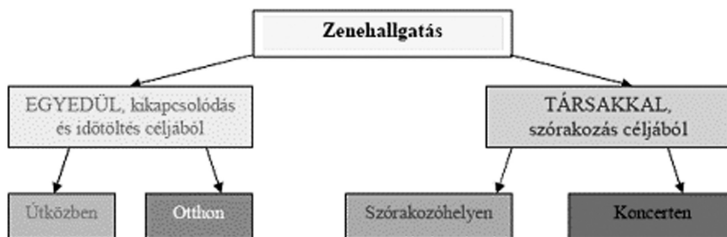
1. ábra: A zenehallgatás funkciói

A tapasztalatok azt bizonyították, hogy a zenehallgatás, a zenei ízlés a kulturális élet más szegmensénél kiemelkedően erősebb csoportformáló jelentőséggel bír – a napjainkban teret nyerő népszerű kultúrát