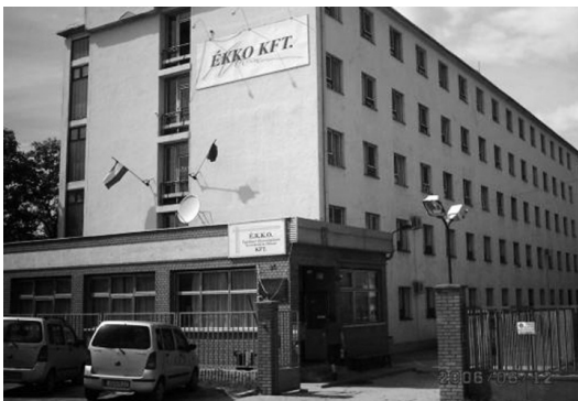
7. ábra: A kollégium épülete

Mind az épületnek, mind az elhelyezkedésének rengeteg negatív oldala van. A Debreceni Egyetem főépületétől a kollégium 40-60 percnyi távolságra van busszal, illetve villamossal. Mivel ebbe a kollégiumba különböző karokról juthatnak be a diákok (ÁJK, BTK, IK, KTK, TTK), innen a város különböző pontjaira kell eljutniuk. Ez természetesen nagy nehézséget jelent, hiszen majdnem egy órával hamarabb el kell indulniuk, hogy időben beérjenek az órára.