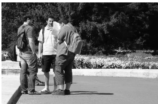
2. és 3. ábra: A bölcsészhallgatók öltözetének illusztrációja

A második megfigyelés az elsőhöz hasonló körülmények között zajlott a Kassai úti TEOK előtt, a koradélutáni órákban, tizenkét óra és délután két óra között; az idő kellemes meleg volt. A megfigyelt hallgatók többnyire csoportokban álldogáltak vagy