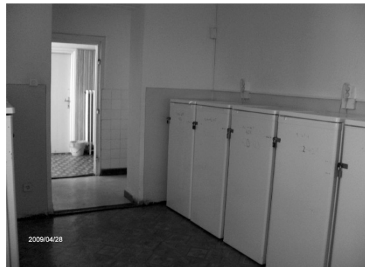
8. és 9. ábra: A konyha és a hűtőszoba a kollégiumban

A kollégium tehát távol van a városközponttól, így a hallgatók kissé el vannak zárva az egyetem központi eseményeitől, rendezvényeitől. Ennek ellensúlyozására a Vámospércsi Kollégiumban nincs hiány programokban.