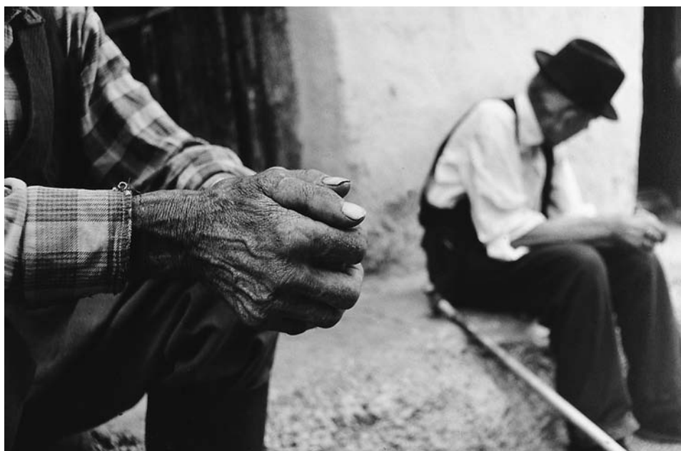
Cím nélkül (1974)