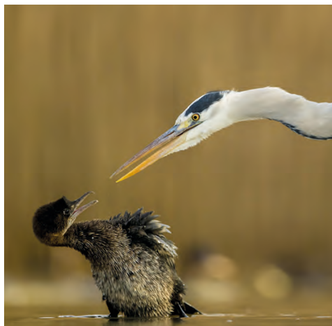
Dávid és Góliát

Az Év Természettudományi Potyó Imre: Téli szárnyak című képe lett. Ez a fotó egészen