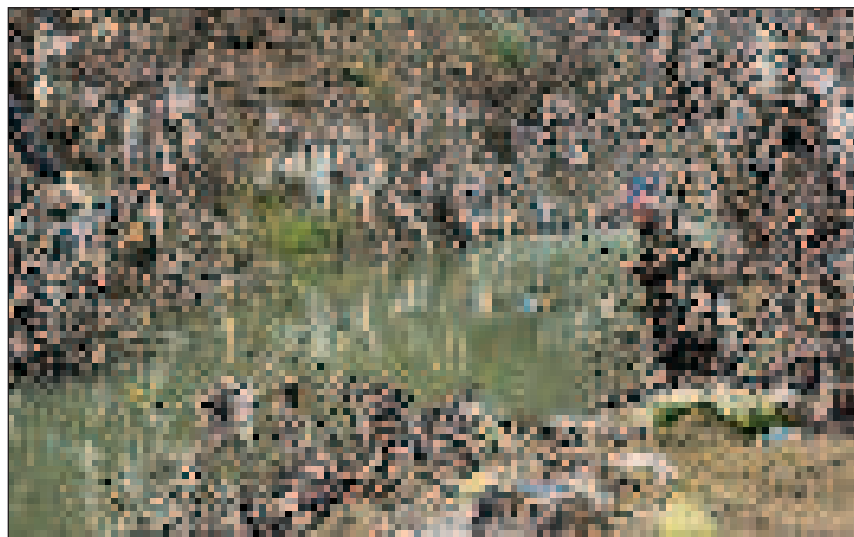
Somodi Ferenc: Nejlonhal

Mint tudjuk, a Csaucseszku-éra elrettentő falupusztításának példaképévé vált ez a völgyzárógát-építés nyomán elárasztott település. Ma már az ércbányászat melléktermékeként keletkező színes zaggal szennyezett vízből csak az egykori katolikus templom tornya mered szörnyű felkiáltójelként az ég felé a valaha mesebeli szépségű tájban. De szerencsére, találunk olyan képet is, amely az ember és a természet békés egymás mellett élésének jegyében született. Kerekes M. István: Jaguar rókával című fotója láttán a helyzet komikumá csal mosolyt az arcunkra.