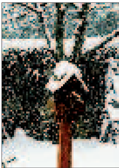
Esti hóesésben elárvult madáretető

„Márma van karácsony szentelt ünnepe, A nép megváltója márma születe; Jó hogy ez egy emlék megmaradt reánk, Mert feledtük volna, hogy megváltatánk.” ( Karácsonykor – részlet)