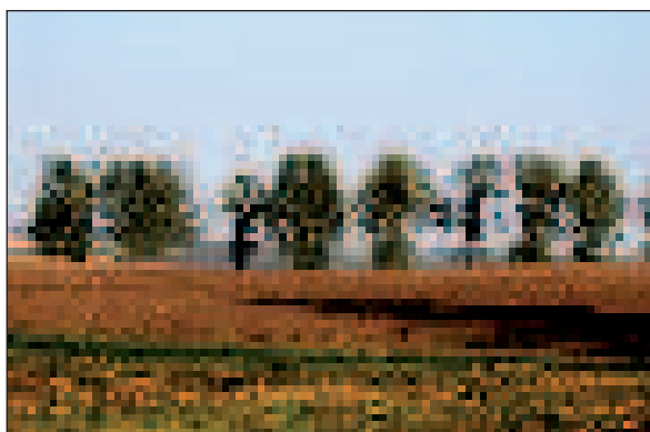
A 811-es út vadgesztenyéi jó 30 évvel ezelőtt

Mi most egy ugyancsak kevésbé híres és nem védett vadgesztenyesorra tekintünk: a Székesfehérvár-Bicske közötti 811-es út lovasberényi, nagyjából egy kilométernyi szakaszára.