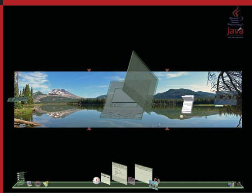
■ 8. ábra A forgatás így még látványosabb...

Érdekes effektus, hogy egy alkalmazás vonzólása (áthelyezése) közben – legyen az akár 2 vagy 3 dimenziós – picit elfordul.