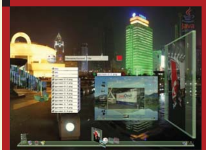
■ 5. ábra Néhány program futás közben,...

található a menü, amiből a programokat indíthatod, néhány indítóikon, középen az éppen futó programok kicsinyített másai, a jobb sarokban pedig a háttérkép választó alkalmazás ikonja és a kilépés gomb. Próbaképpen indítsuk el a bevezetőben már említett LgScope 3D fájlkezelőt. Ezt úgy tehetjük meg, hogy az