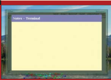
■ 2. ábra Épp az xterm ablak hátára írok jegyzetet

Az aktuális könyvtár fájljait és alkönyvtárait ikonok helyett egy egy téglatest reprezentálja. A téglatest fizikai mérete jelképezi a fájl méretét, de ha elforgatjuk a programot (mert egy 3 dimenziós térben lévő 3 dimenziós programmal ezt megtehetjük) akkor a téglalap alján megtaláljuk a pontos méretét, és még számos más adatot, amit egy hagyományos fajkezelő Properties ablakából tudhatunk meg. Duplán kattintva egy képet reprezentáló téglatestre az megjelenik, mindenféle keret nélkül, csupán a neve van fölé írva, ezzel azt a hatást keltve mintha egy papírkép lebegne a szemünk előtt.