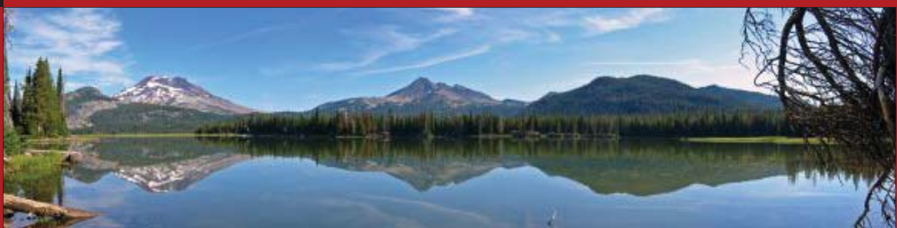
■ 7. ábra Egy a Looking Glassal érkező panorámaképek közül

Mivel a háttérkép egybefüggő, az alkalmazásokat egyszerűen áttolhatjuk a panorámakép egyik szeletéről a másikra. Ha pedig egyben szeretnénk látni a panorámaképet, akkor kattintsunk a tálcára a jobb egér-