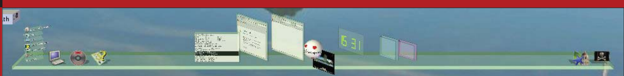
■ 3. ábra A Looking Glass tálcája is 3 dimenziós