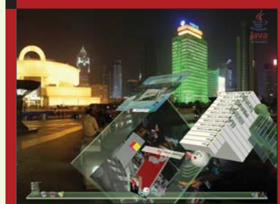
■ 6. ábra ...majd ugyanazok elforgatva

A Looking Glassban találunk egy a háttérképekkel kapcsolatos