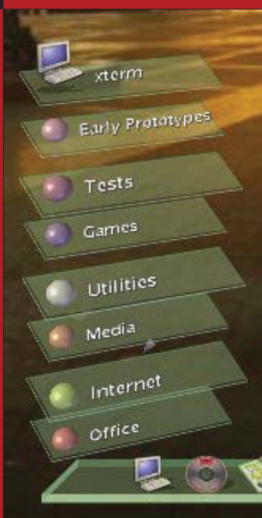
■ 4. ábra Ha az egérrel rámutatsz a menüre annak mérete megnő

található a menü, amiből a programokat indíthatod, néhány indítóikon, középen az éppen futó programok kicsinyített másai, a jobb sarokban pedig a háttérkép választó alkalmazás ikonja és a kilépés gomb. Próbaképpen indítsuk el a bevezetőben már említett LgScope 3D fájlkezelőt. Ezt úgy tehetjük meg, hogy az