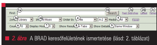
2. ábra A BRAD keresőfelületének ismertetése (lásd: 2. táblázat)

Ha valaki adott zeneszámra szeretett volna rákeresni, akkor mindhárom alkalmazással – BRS , a Nemzeti Rádió Selector a és a Concert FM Selector a – meg kellett próbálkozni. Mindhárom rendszerben nem lehetett egyszerre keresni. Szerencsére a Selector hoz volt egy az adatok XML formátumba való kimentésére alkalmas segédprogram. Igaz, leírás nem volt hozzá, és nem is sikerült szerezni, Bruce -nak sikerült rájönnie működésének módjára. Az adatokat így ki tudjuk menteni, illetve egy windowsos munkaállomásról FTP -n keresztül fel tudjuk tölteni a BRAD kiszolgálójára. A műveletet minden reggel elvégezzük, a BRAD kiszolgálóján pedig egy Perl parancsfájl gondoskodik az adatok beemeléséről. A Concert FM öt adatbázisát egyetlen táblába egyesítettük, ugyanis az adatok egyediek. Az eredeti keresőmodult kibővítettük, így már egynél több táblában is képes keresni, illetve a mezők számától és típusától függetlenül képes visszaadni az eredményeket. Az eredmény lapozós stílusban jelenik meg. (3. ábra) Az ábrán a Works táblából származó első találatok láthatók. A másik fülön a Concert FM Selector táblájából származó eredmények száma látható. A keresés hatókörétől és a találatok számától függően tetszőleges számú lap megjelenhet. A műsorszerkesztők így végre egyetlen felületen keresztül bármilyen típusú zenére rá tudnak keresni. Az első változat elkészítése óta munkatársaink kérésére számos további szolgáltatással bővítettük a rendszert. Ilyen például a keresési történet