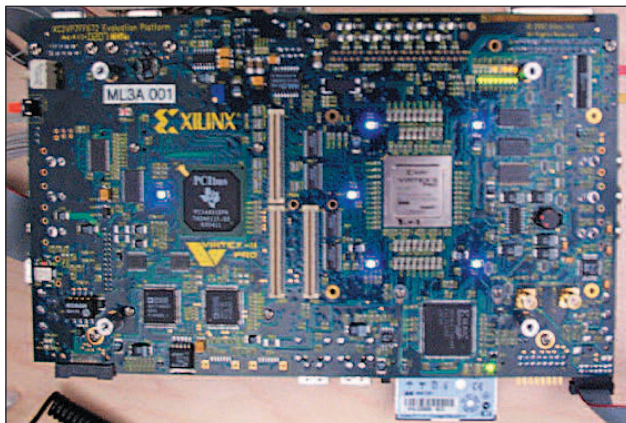
A Virtex-II Pro ML300 felülnézetből

ségével a készülékek és a programok tervezői beágyazott alkalmazásait fejleszthetik és hibajavítással láthatják el. Az alkalmazástól függően a felhasználók általában a kereskedelmi, készen megvásárolható valós idejű operációs rendszerek közül választanak, vagy beágyazott Linuxot telepítenek. A Linux világból a Xilinx a Virtex-II Pro FPGA családhoz rendkívüli sokoldalúsága miatt a MontaVista Linuxot választotta, mint a céljainak leginkább megfelelő beágyazott operációs rendszert. A Linux alapállapotban is rengeteg eszközt támogat. A Xilinx és a MontaVista Software réteges eszközillesztő szerkezet fejlesztése mellett döntött. Ez egy alacsony szintű, operációs rendszertől független rétegből áll, amely közvetlenül a vasat kezeli; valamint egy operációs rendszertől függő illesztési rétegből, ami az operációs rendszer és az alacsony szintű eszközillesztők közé fészkel be magát. A Xilinx készíti az alacsony szintű eszközillesztőket, amelyek így a lehető legjobban kihasználják a modulok képességeit. A MontaVista Software a linuxos illesztési réteget készíti el,