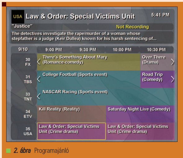
2. ábra Programajánló