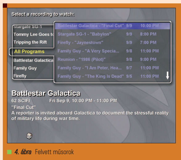
4. ábra Felvett műsorok

A másik lehetőség a MythWeb telepítése, ami egy Apache-alapú webes kezelőfelületet biztosít, ahol megnézzük a programfüzetet, az ütemezett felvételeket és a már felvett műsoro-