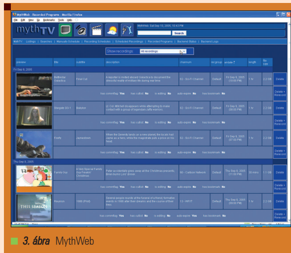
3. ábra MythWeb

hangolásához különböző értékeket írhatunk a megfelelő adatbázistáblába, majd a csatornákat távvezérlővel változtatva megnézzük, hogy javult-e a helyzet.