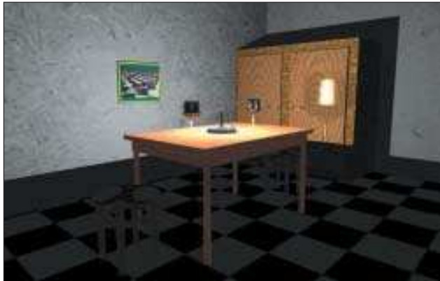
3. kép Szoba szőnyeg nélkül

A spirálokat szintén használhatjuk color_map -pel, pigment_map -pel és texture_map -pel együtt. Az utolsó mintázat, amit még be szeretnék mutatni, a wrinkle nevet kapta és leginkább a gránithoz hasonlítható, azzal a különbséggel, hogy az átmenetei nem annyira finomak, inkább élesebbek. A mintázat gyűrött celofán vagy fólia megjelenítésére használható, viszont nem alkalmazhatjuk normálvektorok módosítására. A color_map , pigment_map és a texture_map a wrinkle -lel is kényelmesen együtt használható.