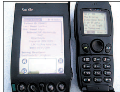
Vezetési útmutatás vezeték nélküli rendszeren

Azt szerettük volna elérni, hogy a használat során a felhasználók bármilyen egyszerű eszköz – esetünkben mobiltelefon – segítségével hozzáférhessenek az adatbázisok tartalmához. A rendszert a gyakorlatban elsőként egy beteg hazavezetésével próbáltuk ki. Böngészőt futtató mobiltelefonon, illetve vezeték nélküli Palm Pilot gépen kapta kézhez az útmutatásokat. Fordítási módszerünk segítségével lehetővé vált, hogy webes alkalmazásokat (jelen esetben egy 150 oszlopos jelentést) egy új sablon segítségével a vezeték nélküli készülékek világában is felhasználjunk. Az átírás