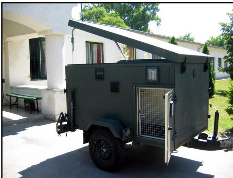
3. számú ábra. Légkondicionált kutyaszállító utánfutó 21