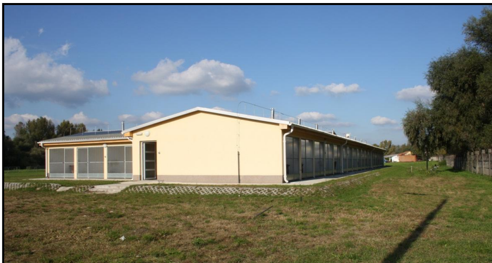
2. számú ábra. Állandó elhelyezést biztosító kennel az MH Hadikikötőben 19

A kennel területén kutyaólat is ki kell alakítani, amely biztosítja az állat feladatok közötti zavartalan pihenését. A kutyaházat úgy kell kialakítani, hogy hűvösebb időben az állat legyen képes azt testhőmérsékletével befűteni. Az állatok elhelyezésénél figyelembe kell venni az adott faj élettani területigényét, illetve a vonatkozó állategészségügyi szakhatósági, illetve építési szakhatósági előírásokat. A szolgálati kutya elhelyezése során különös figyelmet kell fordítani a közegészségügyi, járványügyi, állat-, környezet- és munkavédelmi előírások betartására és betartatására.