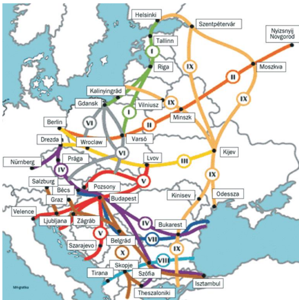
1. számú ábra. Páneurópai közlekedési folyosók (forrás: Fleischer Tamás: Transzeurópai folyosók – A meglévők hosszabbítgatása vagy egy összeurópai hálózat kialakítása? In: Glatz Ferenc (szerk.): A Balkán és Magyarország – Váltás a külpolitikai gondolkodásban? MTA Társadalomkutató Központ – Európa Intézet, Budapest, 2007., pp. 365-379., 373. o.)

A Magyarországot jelenleg érintő nemzetközi vasúti korridorok az alábbiak (2. ábra):