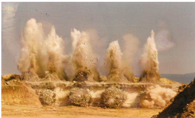
3. számú ábra. Halmajugra volt borászati üzem földbe süllyesztett vasbeton tartályainak vízpuffer alatti robbantásos bontása a robbanás pillanatában 25

A 3. számú ábra által szemléltetett, Halmajugrán végzett vízpuffer alatti kísérleti robbantás esetében is csupán feltörő vízpára figyelhető meg a robbanás pillanatában.