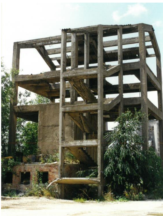
2. számú ábra. Az egykori előosztályozó vasbeton szerkezete a lépcsőház mögött, +2,8 m fölött elhelyezkedő zárt tartállyal 10

Az 1. táblázat tartalmazza az építmény vízpuffer alatti és a hagyományos fúrtlyukas technikával való robbantásos bontás anyagszükségeit.