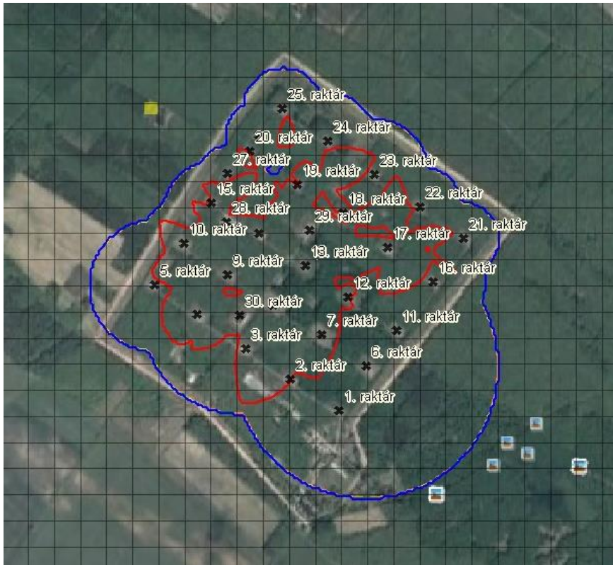
1. számú ábra. Rombolási sugarak ábrázolása az objektum vázlatán

Számításokat kell végezni arra vonatkozóan, hogy a raktárépületben bekövetkezett tömeges robbanás rombolási sugara megállapítható legyen. Ennek érdekében figyelembe kell venni a védműveket, a raktárépület anyagát és természetesen a benne tárolt harcanyagok mennyiségét. A raktár épületenkénti számvetések eredményeinek feldolgozása során a rombolási sugarak grafikusán ábrázolhatók az objektum vázlatán, melyen vizuálisan megfigyelhető elműködés esetén a raktárak egymásra gyakorolt hatása (1 számú ábra).