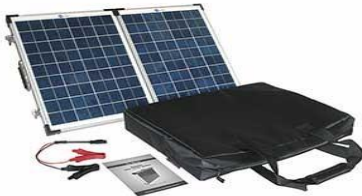
4. számú ábra. Hordozható, nagy teljesítményű napelemes töltő 54