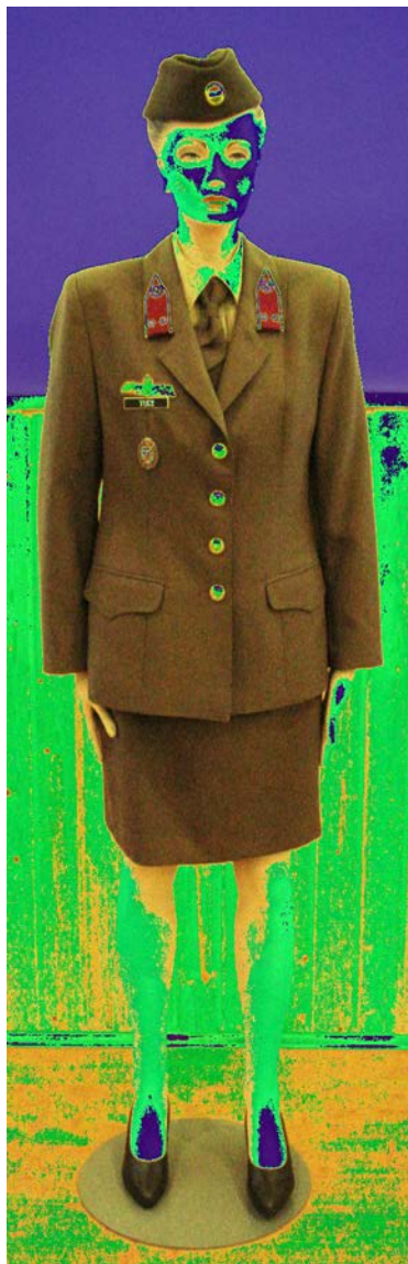
Köznapi tiszti öltözet