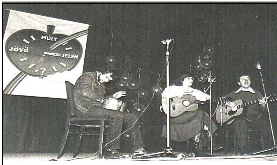
Az Ifjúmunkás Matiné egyik kolozsvári előadásán