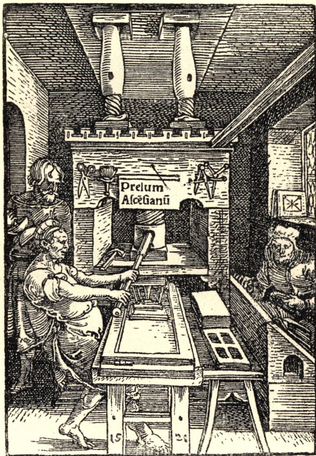
Jodocus Badius nyomdajele 1520. évből.

Ascensianum“-ra,* mely szintén ilykép tünteti fel a nyomót munka közben. Mi a magunk részéről inkább vagyunk hajlandók De Vinne nézetét elfogadni; ebben a tekintetben támogat bennünket ugyancsak a híres