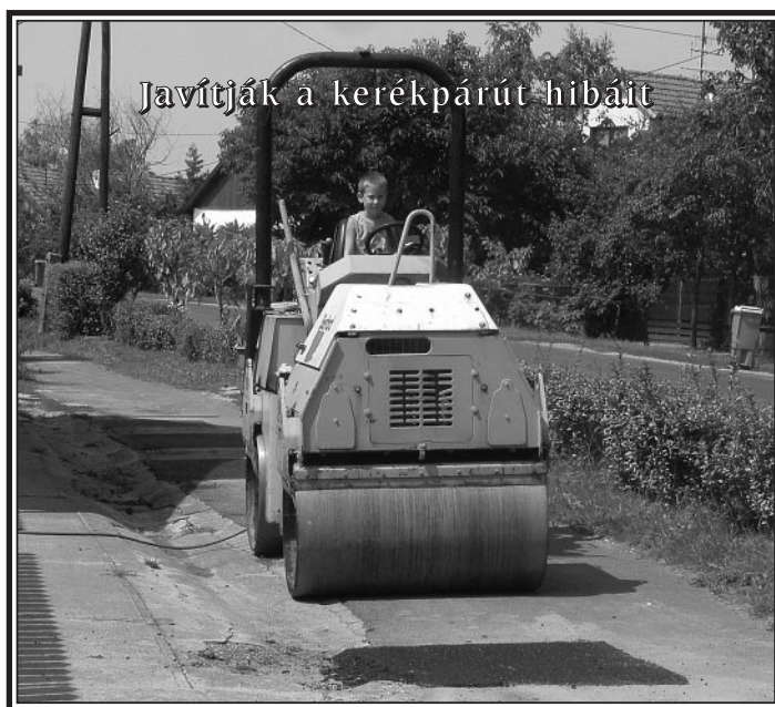
Javítják a kerékpárút hibáit