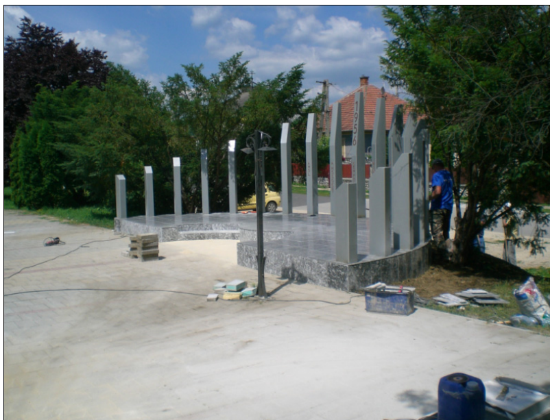
Készül az emlékmű

Az 1956-os Emlékbizottság megbízásából 2016-ban a Közép- és Kelet-európai Történelem és Társadalom Kutatásáért Közalapítvány pályázatot írt ki (KKETTKK - 56P - 02 jelű) az 1956-os forradalmat és szabadságharcot valamint a kapcsolódó történelmi eseményeket felidéző, a hősöknek és az áldozatoknak emléket állító úgynevezett „Büszkeségpontok” létrehozására az 1956-os forradalom és szabadságharc 60. évfordulója alkalmával, amely keretében emlékművek, emlékhelyek létesítésére nyílt lehetőség. A nagy érdeklődésre való tekintettel a pályázatot meghosszabbították és így 2017-ben is nyújthattak be pályázatot az érdeklődők.