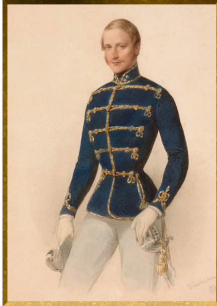
Gróf Csáky László fiatalkori képe

Az alábbiakban részletet közlünk a Vasárnapi Újság 1891. évi 4. számában gróf Csáky László elhunytá alkalmával megjelentetett nekrológból.