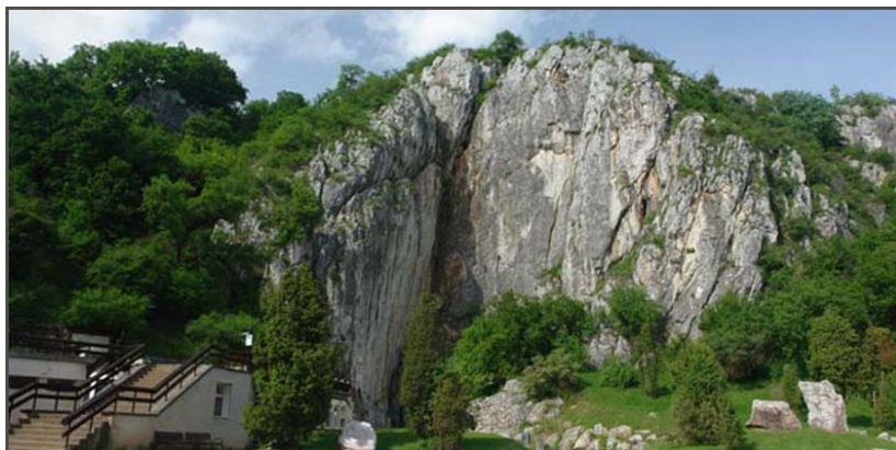
A Baradla-barlang aggteleki bejáratát rejtő sziklafal.

Az Aggteleki- és a Szlovák-karszt barlangjait az UNESCO Világörökség Bizottsága 1995. december 6-án Berlinben tartott ülésén a Világörökség részévé nyilvánította.