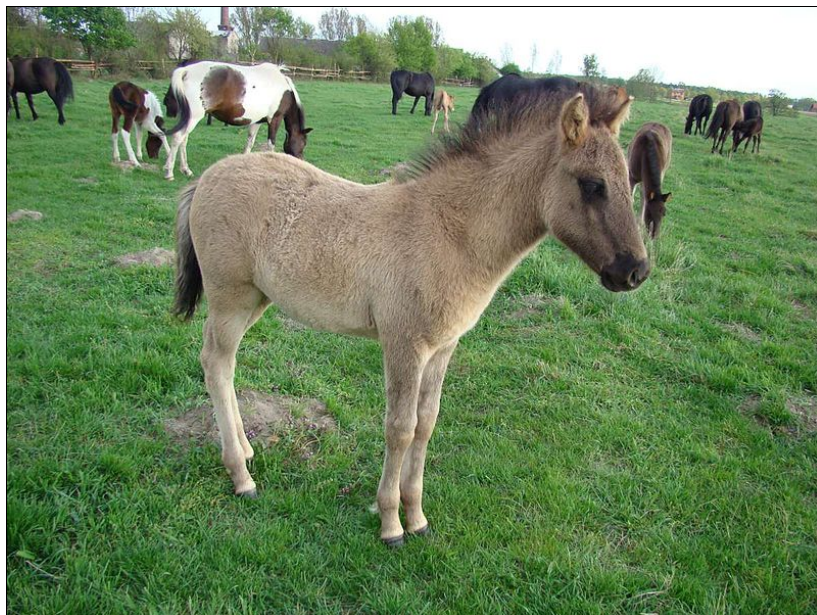
Hucul csikó. A ménest, génmegőrzés céljából 1986-ban telepítették a Jósvafő határában lévő Haragistyára.