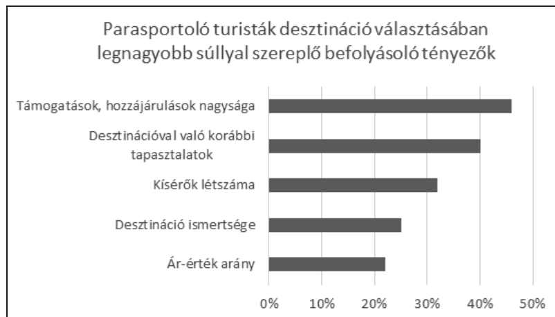
2. ábra: A parasportolók kérdőíveinek egyik főbb megállapítása